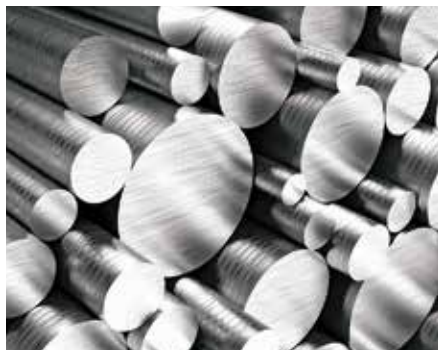
Sortierung von Aluminium-Rohmaterial