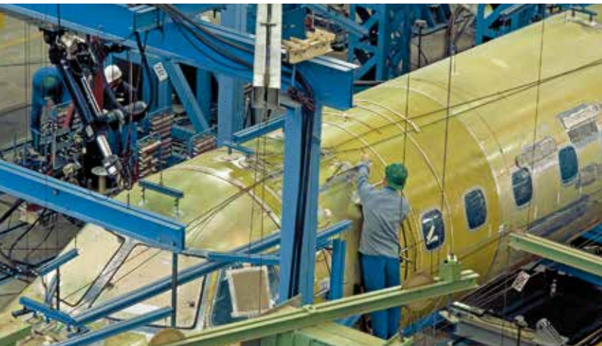
Bei der Fertigung, Wartung oder Reparatur von Flugzeugen ist die Leitfähigkeitsmessung ein wichtiger Bestandteil der Qualitätssicherung

Das SIGMASCOPE® SMP350 misst die elektrische Leitfähigkeit. Dabei wird das phasensensitive Wirbelstromverfahren genutzt, das nach DIN EN 2004-1 und ASTM E 1004 für die Leitfähigkeitsmessung herangezogen werden kann. Diese Art der Signalauswertung ermöglicht eine berührungslose Messung, auch unter Lack- oder Kunststoffbeschichtungen bis zu 500 µm Dicke. Durch das Verfahren wird auch der Einfluss der Oberflächenrauheit minimiert.